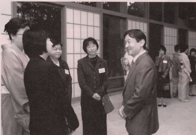
皇太子殿下から励ましとお祝いのお言葉を賜った