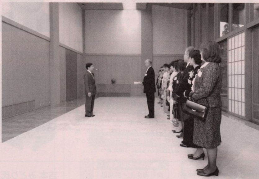
表彰式典前日、受賞者は東宮御所に参内、皇太子殿下に接見

受賞者は式典前日、東宮御所において、皇太子殿下から励ましとお祝いのお言葉を賜った。