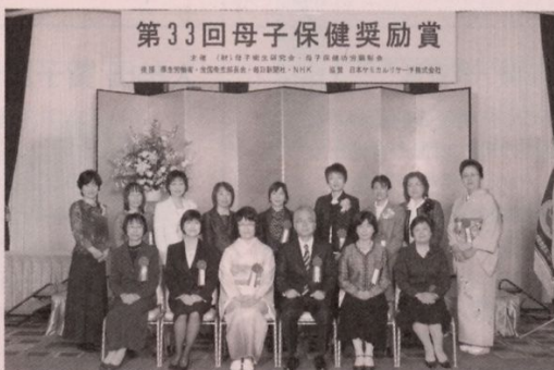
栄えある15人の受賞者